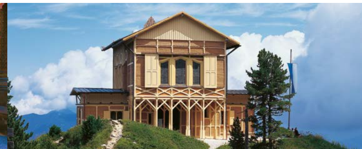
La maison royale de Schachen

C'est dans un site grandiose, à 1800 m d'altitude et avec le massif du Wetterstein en arrière plan, que le roi Louis II fit construire ce petit château. Alors que la façade et l'aménagement intérieur du rez-de-chaussée sont d'apparence modeste, le salon turc du premier étage se distingue par son luxe oriental intégrant une fontaine et des divans. Le roi aimait fêter son anniversaire et son saint patron dans ce pavillon isolé, accessible uniquement à pied à partir d'Elmau, Mittenwald ou Garmisch-Partenkirchen.