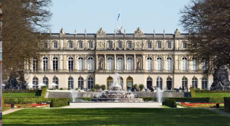
Le château de Herrenchiemsee (Nouveau château)