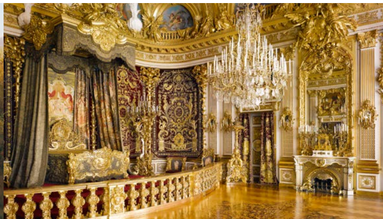
La chambre d'apparat du château de Herrenchiemsee

Le bâtiment et son parc ne furent toutefois jamais terminés. Les plans prévoient de réaliser un magnifique parterre d'eau, similaire à celui de Versailles et qui aurait dû couvrir la quasi-totalité de l'île. Aujourd'hui, le Nouveau château est entouré d'un parc naturel et de biotopes importants. Il abrite par ailleurs un musée consacré à la vie et à l'œuvre de Louis II, souverain que Paul Verlaine qualifia en 1886 de « seul vrai roi du XIX e siècle ».