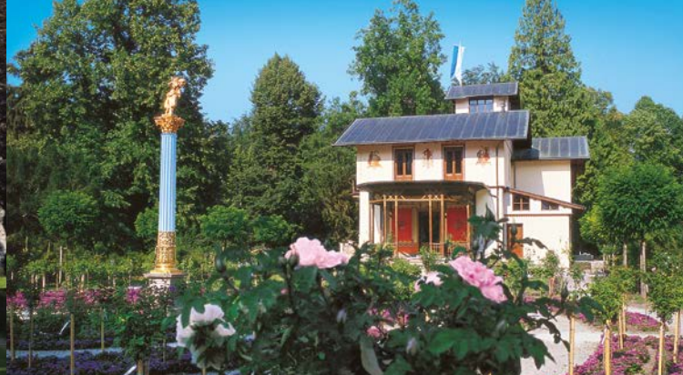
La roseraie à l'est du casino