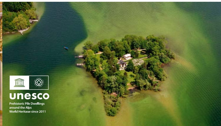
L'île des Roses entourée de bas-fonds

Sur la rive est du lac, à proximité du château de Berg, se trouve une chapelle votive construite près du lieu où le roi Louis II fut retrouvé mort le 13 juin 1886.