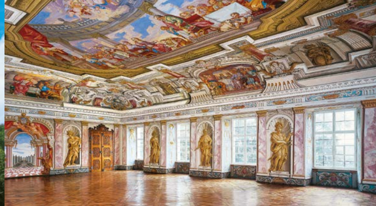
Salle impériale baroque du couvent des chanoines augustins