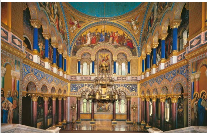
La salle du Trône du château de Neuschwanstein

Des tentures inspirées de légendes nordiques et chevaleresques agrémentent les intérieurs. La salle des Chantiers s'inspire de deux salons du château de Wartburg, tandis que la salle du Trône, qui glorifie la monarchie, rappelle les églises byzantines et paléochrétiennes.