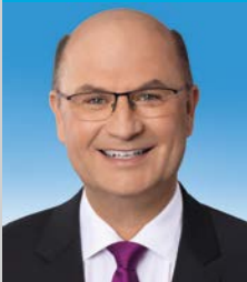
Albert Füracker, MdL Ministro bavarese delle Finanze

Vi auguriamo un'entusiasmante visita ai Castelli di Ludovico III!