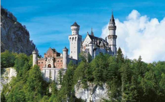
Il Castello di Neuschwanstein