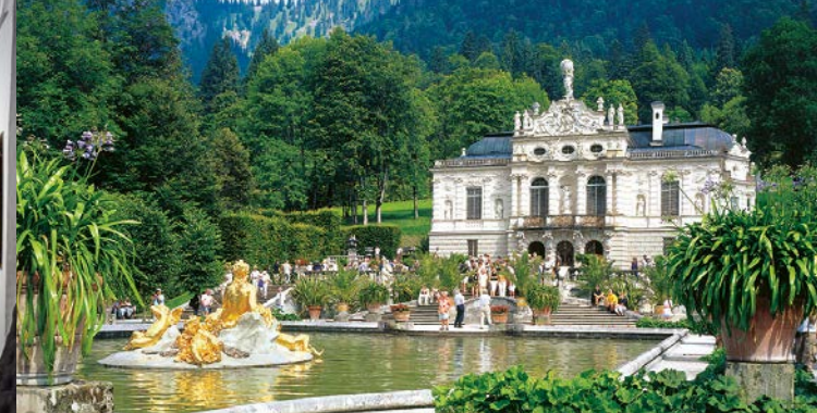
Facciata principale del Castello di Linderhof