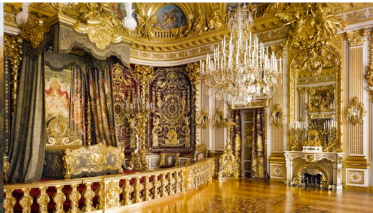
La Stanza da letto da parata nel Castello di Herrenchiemsee

Questo monumento alla monarchia assolutista sorse a partire dal 1878 e superò di molto il suo modello di Versailles nella sontuosità degli arredi. La Stanza da letto da cerimonia nell'Appartamento Grande fu la stanza più dispendiosa del XIX secolo. La dotazione di porcellana dell'Appartamento Piccolo è la più grande committenza singola che la manifattura di Meissen abbia mai ricevuto. I ricami dei tessuti non temono paragoni per ricchezza e qualità. Herrenchiemsee peraltro è rimasto incompiuto come il parco circostante, ispirato al modello di Versailles e ai suoi grandi giochi d'acqua, che avrebbe dovuto comprendere la maggior parte dell'isola. Oggigiorno il parco è circondato da un'area allo stato naturale con importanti biotopi. Nel castello l'ampio Museo di Ludovico II illustra la vita e l'operato di questo 'vero unico re dell'Ottocento', come lo definì Paul Verlaine nel 1886.