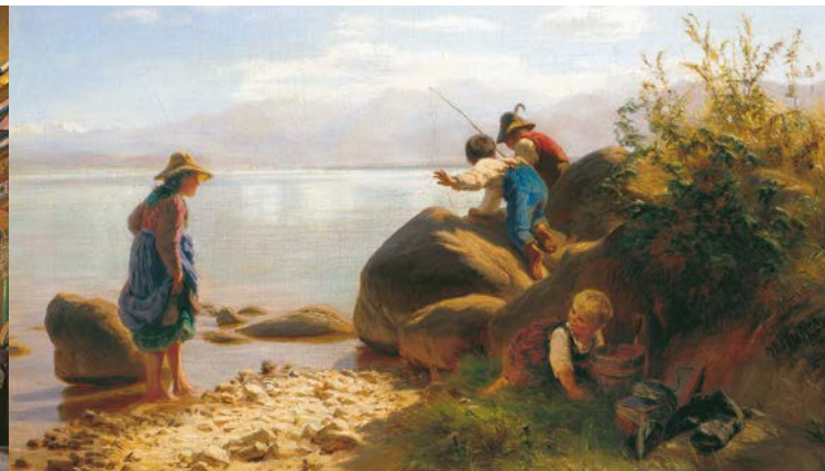
'Bambini che pescano sul lago Chiemsee', F. W. Pfeiffer

Il più antico convento bavarese venne fondato nella prima metà del settimo secolo. Dal 1215 fino alla secolarizzazione nel 1803 fu anche sede vescovile con relativo duomo. Ancora oggi i saloni della Biblioteca, dell'Imperatore e del Giardino rimandano alla sontuosità barocca dell'antico convento. Nel 1873, dopo aver acquistato la Herreninsel, il re Ludovico II fece sistemare alcune stanze residenziali all'interno del complesso conventuale in base alle sue disposizioni. Qui soleva soggiornare quando intendeva supervisionare i lavori del Nuovo Castello. Nel 1948 nell'ex convento, in seguito denominato Vecchio Castello, si riunirono i delegati dell'Assemblea Costituente, incaricata della stesura della Legge Fondamentale tedesca. Inoltre il Vecchio Castello ospita nelle sue sale anche la galleria dei pittori del Chiemsee e le opere di Julius Exter.