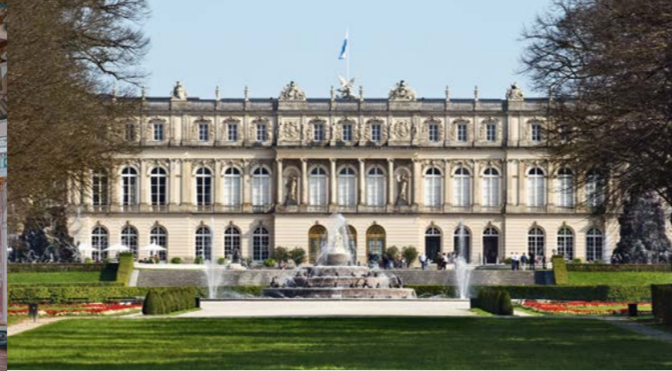
Il Castello di Herrenchiemsee (Castello Nuovo)