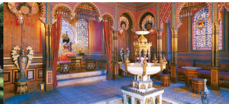
Il Chiosco moresco a Linderhof