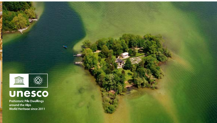
L'Isola delle rose e le circostanti zone di acqua bassa

Ludovico II amava questa isoletta dove si trovava il Casino di suo padre, arredato in stile pompeiano. Negli anni giovanili vi invitò ospiti speciali, ad esempio la zarina russa Maria Alexandrovna. Di tanto in tanto vi si incontrava con l'imperatrice Elisabetta d'Austria, a lui spiritualmente affine. Il giardino delle rose venne ricostruito piantandovi molte specie storiche profumate. Il Casino, restaurato in modo impeccabile, può essere visitato insieme al suo raffinato arredo. Nella Casa del giardiniere una piccola mostra informa sulla sorprendente lunga storia dell'isola. I resti di palafitte preistoriche sul fondale del lago di Starnberg intorno all'Isola delle rose sono stati dichiarati Patrimonio mondiale da parte dell'UNESCO. Sulla sponda orientale del lago, prospiciente l'Isola delle rose, si trova la Cappella Votiva. Venne costruita proprio al di sopra del punto in cui Ludovico II trovò la morte, il 13 giugno 1886, nelle vicinanze del suo castello di Berg.