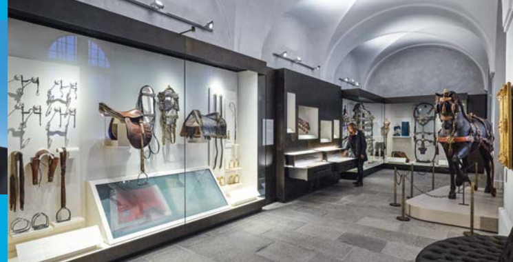
La sala delle bardature e delle selle di re Ludovico II.