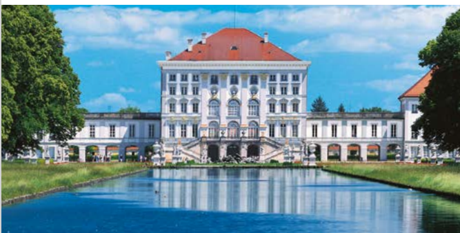
Il Castello di Nymphenburg